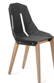
graphite grey grafitowy szary