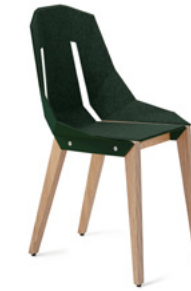
dark green butelkowy zielony