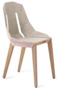
dusty clay retro oranż