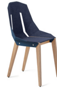
navy blue ciemny niebieski