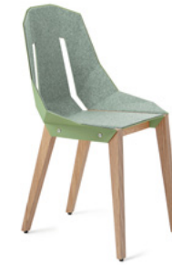
mint green miętowy zielony