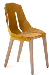
sunny yellow słoneczny żółty