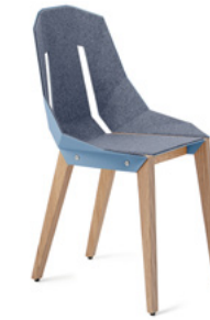
pastel blue pastelowy niebieski