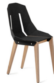
deep black głęboki czarny