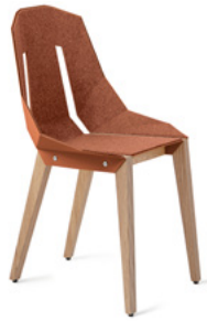
pale pink pudrowy róż