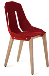
coral red koralowy czerwony