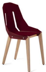
royal burgundy royal bordo