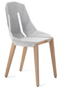
white grey popielaty biały