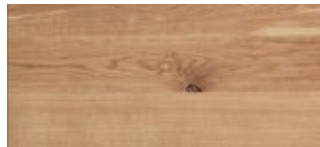
54 | Eiche Naturel

Wird mit Epoxidharz aufgefüllt. Bitte auswählen, Schwarz oder Transparent.