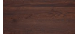
56 | Eiche Smoke

Wird mit Epoxidharz aufgefüllt. Bitte auswählen, Schwarz oder Transparent.