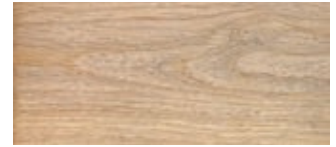
73 | Eiche Eco Snow

Wird mit Epoxidharz aufgefüllt. Bitte auswählen, Schwarz oder Transparent.