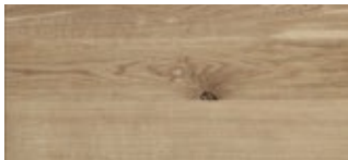
51 | Eiche Bianco

Wird mit Epoxidharz aufgefüllt. Bitte auswählen, Schwarz oder Transparent.