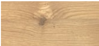
74 | Eiche Fresh Oak

Wird mit Epoxidharz aufgefüllt. Bitte auswählen, Schwarz oder Transparent.