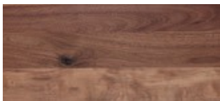
54 | Nussbaum Naturel