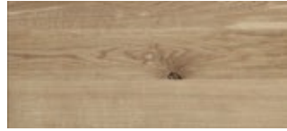
50 | Eiche Naturel

Wird mit Epoxidharz aufgefüllt. Bitte auswählen, Schwarz oder Transparent.